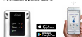
Modulo Wi-Fi BOX (optional)