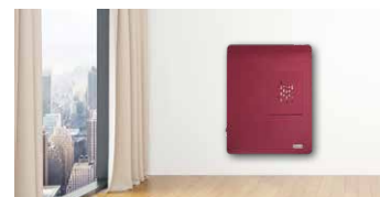
Installazione a pensile (optional)